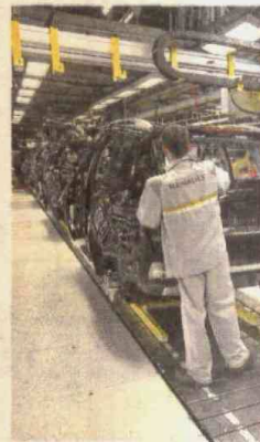
La industria se habría mantenido estable.

por ciento creció la economía colombiana durante el año pasado, según cifras del Dane.