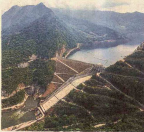
Embalse de Hidrosogamoso, desarrollado por Isagen.

Las cuentas que tiene Caicedo muestran que de los US$25.000 millones que cuesta el programa de vías 4G, cerca de US$14.000 millones serán aportados por el Gobierno. "De este último monto, US$2.500 millones llegarán a las arcas por cuenta de la venta de