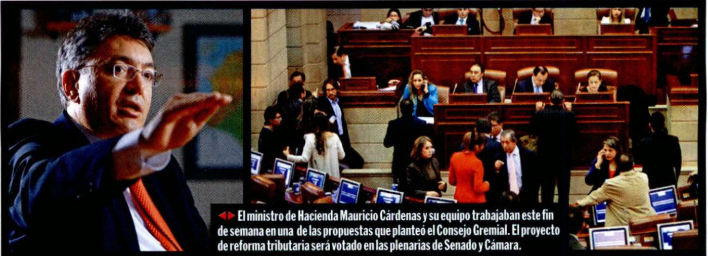
◀ El ministro de Hacienda Mauricio Cárdenas y su equipo trabajaban este fin de semana en una de las propuestas que planteó el Consejo Gremial. El proyecto de reforma tributaria será votado en las plenarios de Senado y Cámara.