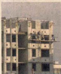
La mano de obra le aportó 1,09 % a la variación anual.

Las ciudades intermedias, como Neiva y Pasto, fueron las que más crecieron en el 2014.