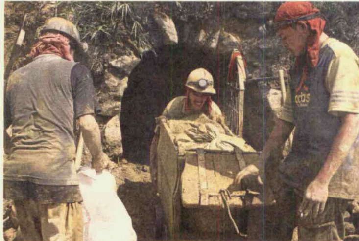
Los municipios podrán fijar, con las autoridades nacionales, zonas excluidas de la minería.

Según el decreto 2691, los municipios tienen hasta marzo para enviar al Ministerio las solicitudes de declaración de zonas excluidas de la Minería. La cartera tendrá 10 días hábiles para confirmar el recibido y si la solicitud no cumple con los requisitos pasará a estudio de la autoridad competente, que tendrá 20 días (prorrogable por 20 más) para resolver si aprueba la exclusión solicitada por la autoridad municipal.