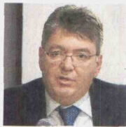
Mauricio Cárdenas, ministro de Hacienda.

abocado a hacer más recortes en el gasto, si pretende que la situación no se agrave. "A menos que mejore en productividad e inversión, Colombia no parará la desaceleración económica", sentenció.