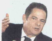
Germán Vargas Lleras, vicepresidente.

Por otra parte, el Vicepresidente expuso todo su plan estratégico de inversiones en vías de cuarta generación, puertos, aeropuertos y ferrocarriles, y dijo que lo que el Gobierno está haciendo es sacar el país del retra-