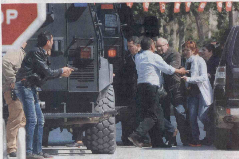
Turistas son retirados del sitio del ataque por hombres armados de la policía tunecina. Murieron 17 visitantes extranjeros en los hechos.

AÑO 104 - Nº 36624 - AFILIADO A SIP Y ANDIARIOS - ISSN0121-9667