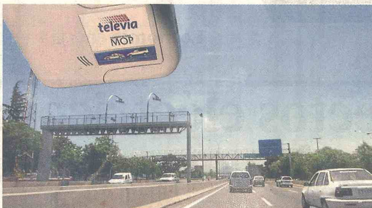
En Chile existe un sistema de reconocimiento automático de vehículos en movimiento que permite el cobro de peajes no solo en carreteras sino también en vías urbanas.

Ciudades como Medellín, Cali, Barranquilla,