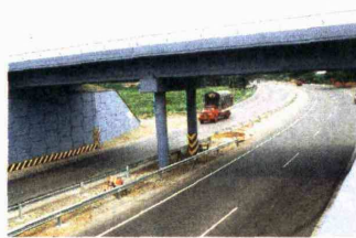
Ya hay 5.000 km concesionados en carreteras que surcan el país como Bogotá-Girardot y Bogotá-Villavicencio.