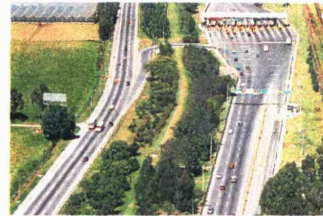
En cinco años culminarían las obras que serán operadas y mantenidas por los concesionarios por otros 20 años más.