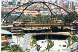
La inversión en obras será de 44 billones de pesos, 18 de los cuales deben quedar asignados al finalizar el 2014.