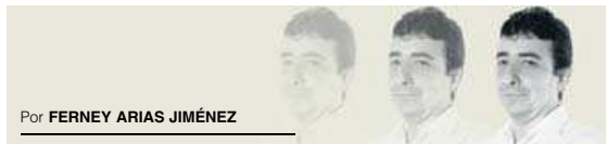
Por FERNEY ARIAS JIMÉNEZ

Según Fedesarrollo y Anif, el país requerirá adelantar una nueva reforma tributaria, para nivelar su