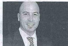
CARLOS JACKS CEO Cemex Latam Holdings

Este año se espera que al menos 38% de las concesiones 4G se pongan en marcha. Aunque el gobierno ha hecho esfuerzos para agilizar la ejecución, todavía falta por resolver un tema crítico: acotar los riesgos para que los recursos financieros fluyan a estos proyectos. No obstante los proveedores de bienes y servicios tenemos la obligación de definir estrategias efectivas para optimización de