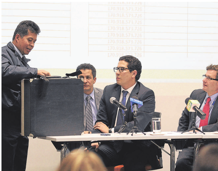
Momentos de la audiencia de adjudicación, previos a la apertura de las ofertas por las vías 4G, ayer.

porcentaje de los proyectos estratégicos de infraestructura que tienen problemas relacionados con las consultas previas.