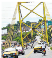
Las obras incluyen un nuevo puente de Flandes.

La obra, que prevé la construcción de dos grandes puentes sobre el río Magdalena, uno entre Girardot y Flandes y otro entre La Dorada y Puerto Salgar, beneficiará a los departamentos de Cundinamarca, Caldas y Tolima, con impacto en Flandes, Girardot, Nariño, Guataquí, Beltrán, Chaguani, Guaduas, Puerto Salgar, Honda y La Dorada.