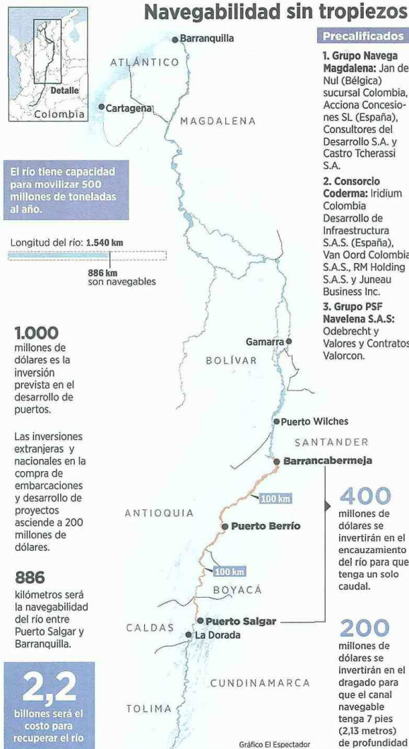
Gráfico El Espectador

bermeja, donde Impala hará inversiones en un terminal para atender el movimiento de combustibles hacia los puertos.