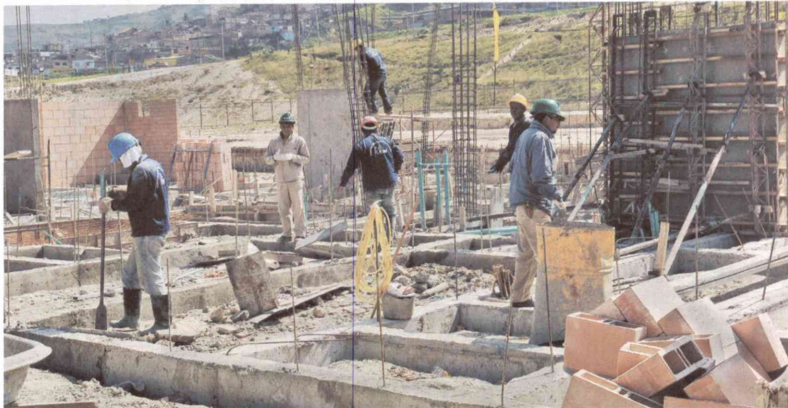
En lo corrido de 2013, el renglón de la construcción presentó un crecimiento del 9,8%. Según el Gobierno, se vio impulsado por las viviendas gratuitas. / Herminso Ruiz

mostró que el PIB se expandió 4,9% entre octubre y diciembre del año pasado, impulsado por un crecimiento de 8,2% en construcción, de 7,7% en minas y canteras y de 6,3% en servicios comunales, sociales y personales. Otros renglones, como agro, suministro de agua, gas y electricidad y establecimientos financieros, presentaron variaciones positivas, pero la industria se contrajo 0,1%.