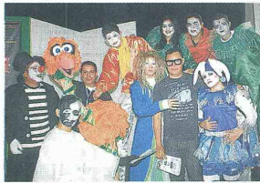
UNA COMPARSA dará la bienvenida a los asistentes al teatro Zulima, hoy durante la inauguración.

del Festival es de $40 millones. Para este año se esperan 12.000 espectadores.